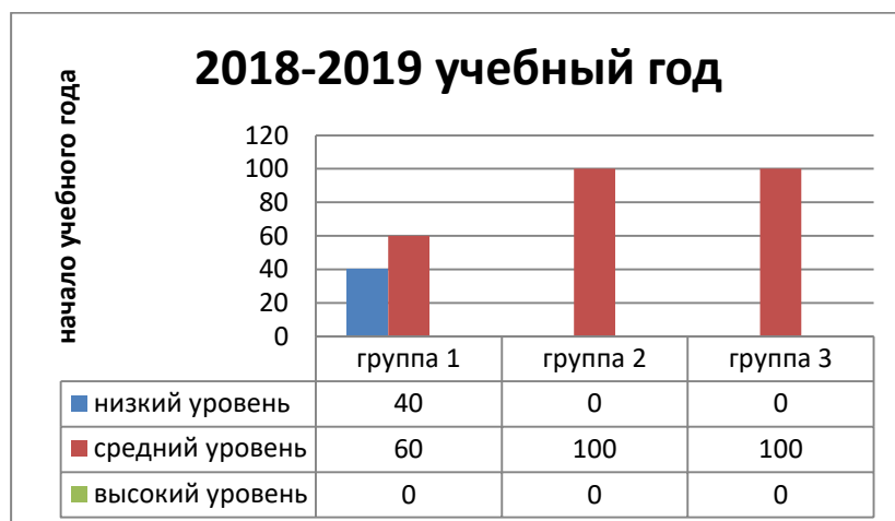
Таблица 2. Сводные результаты мониторинга