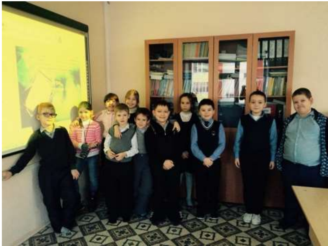
Применение на практике наглядных методов